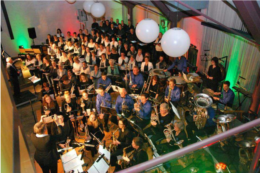
Concert met vocalgroup Sing@Sea