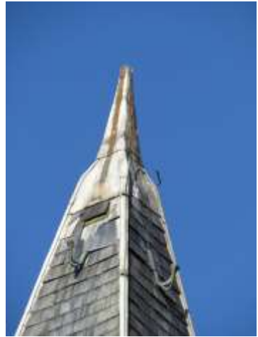
de toren spits voor en na de val