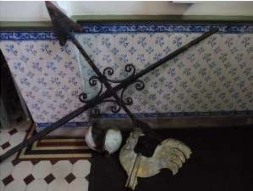
Haan en windwijzer in de hal van de kerk