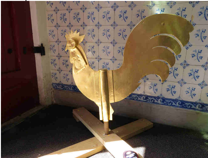
Dorpskrant Nieuwland, jaargang 46 nr. 4, pagina 13