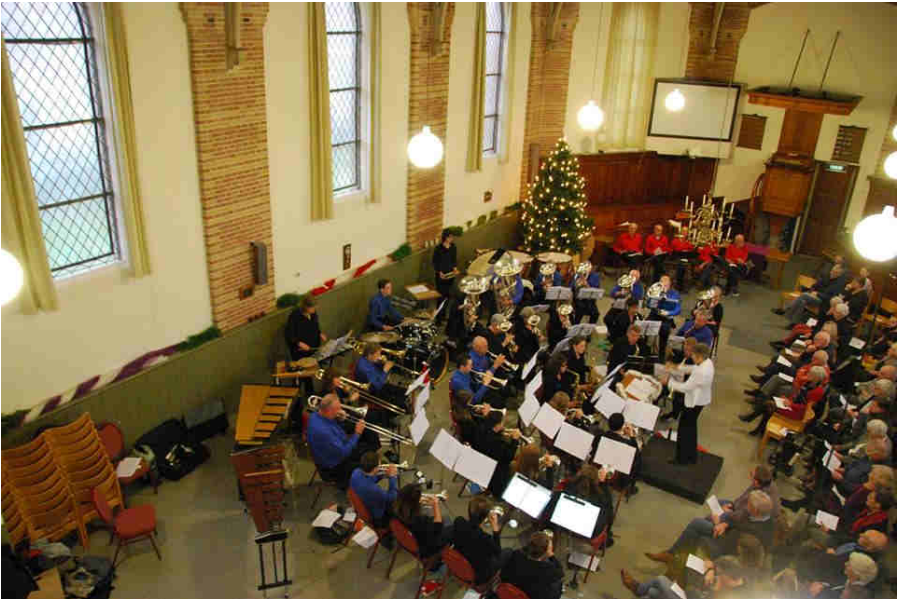
O.N.D.A. samen met zanggroep BrosZ tijdens het kerstconcert op 23 december

Op zondagmiddag 23 december gaf O.N.D.A. een kerstconcert samen met zanggroep BrosZ. Tijdens het drukbezochte concert verzorgde O.N.D.A. en zanggroep BrosZ een afwisselend programma met voor ieder wat wils dat zorgde voor een enthousiast publiek. Vrijdag 15 februari staat de rondgang voor de Lampionoptocht op het programma. O.N.D.A. zal de optocht muzikaal begeleiden. De optocht begint om 19.00 uur bij de Speeltuin in Nieuw- en Sint Joosland.