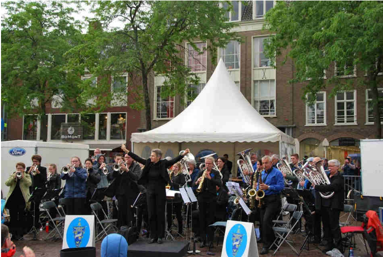
O.N.D.A. geeft een concert tijdens de Veteranen dag op de Markt in Middelburg.