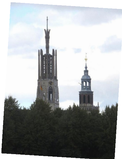
De rit gaat door het land van Hulst