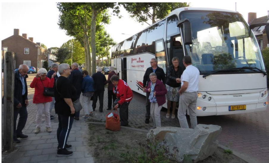
Weer terug op het dorp